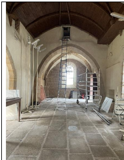
Vue du dallage rejointoyé, du lustre de la travée Ouest restauré et reposé et des appareillages de chauffage approvisionnés.