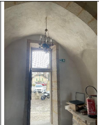
Vues des lustres des chapelles restaurés et reposés