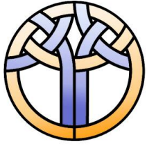
Baie 8 – Jésus – don de la paroisse